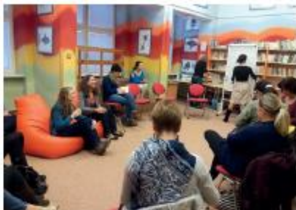
Děkujeme všem školám, že se aktivně do projektu zapojily a že poskytovaly prostory pro vzdělávací akce a pedagogům za účast na všech akcích.

cházet či jak jí řešit. Seminář to byl skutečně velmi užitečný a inspirativní! Listopad patří také dalším dvěma setkáním. První z nich proběhlo 14. listopadu a týkalo se kurzů z oblasti sociálně-právní ochrany dětí. Zúčastnili se zástupci 9 základních škol a během semináře probírali některé konkrétní případy a postupy. Druhým setkáním bylo zasedání zástupců žáků 2. stupně ZŠ, které se usklo- tečilo 20. listopadu a navázalo na úspěšné setkání z června 2017. Jme rádi, že se zúčastnilo všech 5 devítiletých základních škol patřících do našeho OKP a že jsme od žáků mohli načerpat mnoho nápadů na aktivity do novazujícího projektu MAP II.